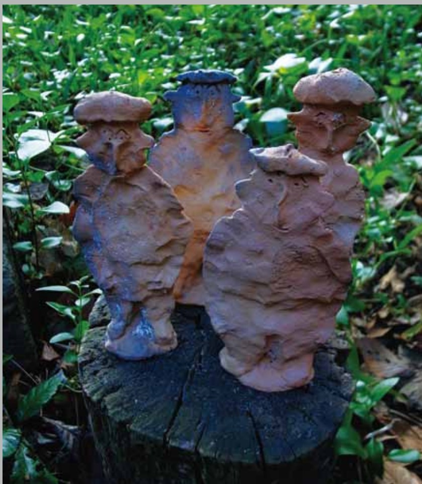
《お人形さん》テラコッタ (h16 ~19cm)

「あかね」は、主に知的障害をもつ人たちの作品を発掘して、そのすばらしさを多くの方々に知っていただく活動をしています。彼らの作品は、とかく純粹だとか、素朴だとかという言葉で片づけられ、そのほとんどが日の目を見ないのです。そんな「夢の住人」たちの作品を施設の中から社会の表舞台へ解き放ち、新しい価値を見出し、「夢の旅人」として一歩を踏み出すための作品展を企画しました。